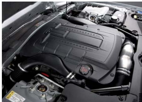
De V8-compressormotor van de Jaguar XKR is goed voor bloedstollende prestaties. In 5,5 seconden snelt de sportcoupé naar 100 km/h.

het brandstoffilter aan de beurt. Bougies zijn van het longlife-type. Ze houden het maar liefst 160.000 km vol. Voor de distributie past Jaguar een onderhoudsvrije distributieketting toe en de transmissie is voor het leven gesmeerd. Ook het antivries van het koelsysteem heeft een lang werkend leven. Pas na 10 jaar of 240.000 km is ver-