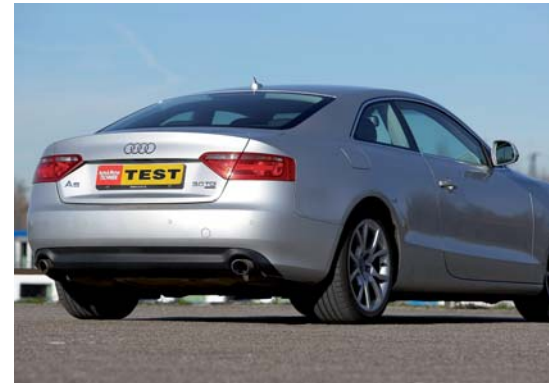
Van achteren ziet de A5 er nogal onopvallend uit en ook niet erg herkenbaar.

De vierpersoons koets van de A5 biedt geen enorme interieurruimte. Voorin zit je uitstekend, maar achterin wordt het voor langere vol-