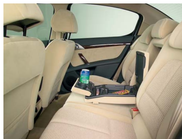
De achterbank zit uitstekend, maar de beenruimte is krap wanneer de voorpassagiers lange benen hebben. Rug en zitting kunnen in ongelijke delen worden omgeklapt.

De 407 is duurder dan zijn voorganger 406 maar hij staat ook wel een heel stuk completer in de showroom. De standaarduitrusting van deze versie omvat naast de genoemde zaken zoals de airco en de elektrisch verstelbare voorstoelen, ook nog lichtmetalen wielen, radio/cd-speler, elektrisch bediende zijruitjes, een regensensor, cruise control, een in twee ongelijke delen omklapbare achterbank, drie geheel in de