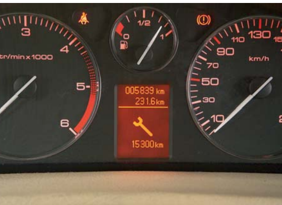
De boordcomputer geeft keurig aan wanneer de 407 toe is aan een onderhoudsbeurt.

beurt beperkt zich tot éénmaal per twee jaar of 30.000 km voor de veelrij-