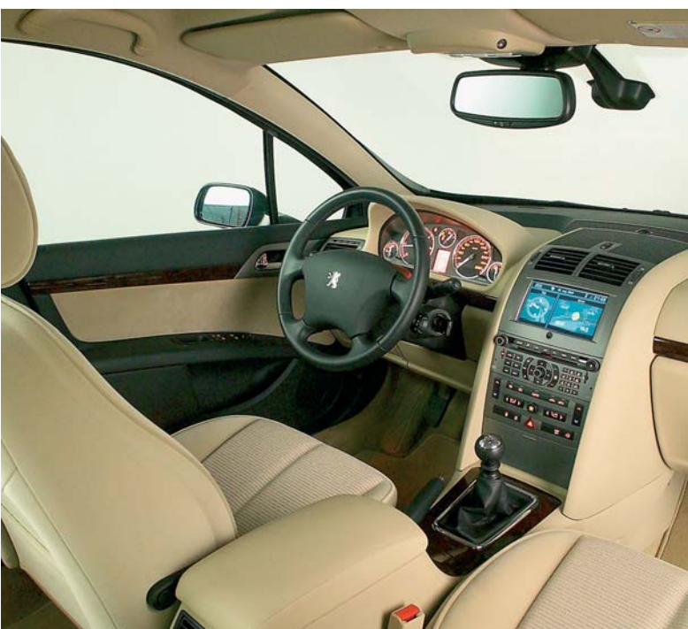
Het interieur maakt een moderne, lichte en goed afgewerkte indruk. De lichte bekleding bovenop het dashboard zorgt voor hinderlijke reflecties.