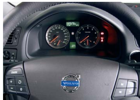
De bestuurder geniet van een uitstekende ergonomie met mooie ronde klokken in een fraai instrumentenbord. Veel functies zijn vanaf het stuur te bedienen.

Het S40 interieur is gegroeid ten opzichte van z'n voorganger, maar echt ruim is het achterin nog steeds niet. Ook moet je achterin rekening houden met een korte verhoging in de vloer vlak voor de achterbank waardoor een grote schoenmaat al gauw in de knel komt. De voorstoelen bieden een stevige zit met een lekkere steun in rug en dijbenen. Dankzij de hoogteverstelling en de kantelbaarheid van zowel de stuurstoel als de stuurkolom, die ook axiaal kan schuiven, zit de bestuurder als gegoeten op z'n werkplek. Volvo ontwierp voor de S40