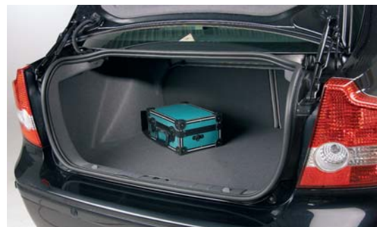
De bagageruimte meet 404 liter en is door de laag uitgesneden achterklep goed bereikbaar. De achterbankrugleuning is in ongelijke delen neerklapbaar.

een mooi instrumentenbord dat in z'n eenvoud en afwerking een voorbeeld is voor andere merken. Ook ergonomisch is alles dik voor elkaar. Cruise control, audio en telefoon worden via knoppen op het stuurwiel bediend. Bijzonder is het 'zwevend' ontwerp van de middenconsole. Op een ultradun gebogen console zijn de bedieningstoetsen van audio, navigatie en climate control gemonteerd. Recht van voren gezien valt je weinig bijzonders op, van opzij zie je pas hoe dun de middenconsole eigenlijk is. Volvo levert de console standaard in plastic, maar als extra aluminium bekleed of transparant. Achter de console is zelfs nog een kleine, maar wel handige bergruimte gecreëerd. Dat is maar goed ook want de portierbakken zijn zodanig klein dat zelfs een pakje sigaretten