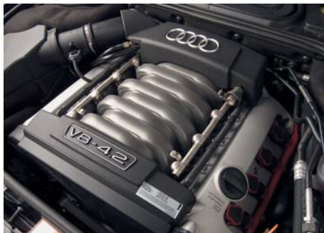
Voorlopig is de A8 alleen met twee V8 motoren leverbaar met een inhoud van 3.7 en 4.2 liter. Diesels volgen later.

en 4.2 V8. Voorgeschreven is het gebruik van hoogwaardige long-life motorolie die voldoet aan de VW 503.00 norm. Daarmee is een verseringsinterval van maximaal 30.000 km of twee jaar mogelijk. De V8 benzine motoren zijn voorzien van hydraulische klepstoters en een distributietandriem, deze dient elke 120.000 km te worden vernieuwd. De bougies gaan 90.000 km mee en het luchtfilter 60.000 km. Het interieurluchtfilter is al tijdens de oliewissel aan de beurt, dus elke