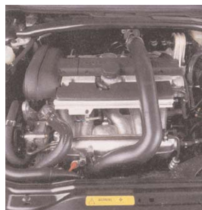
De dwars voorin geplaatste turbomotor: stille geweldenaar, veel rijplezier maar een stevig verbruik.

model hij de bodemplaat deelt. Het scheidt slechts twee en een halve centimeter en de V70 is dus nog steeds een ruime auto. Ten opzichte van zijn voorganger boekt de wielbasis zelfs een winst van bijna 10 cm, dus met de interieurruimte van deze auto zit het wel goed.