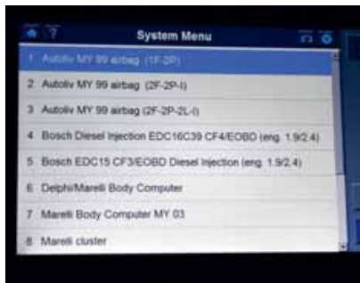
Welk systeem ga je nu kiezen?

De Maxidas DS708 heeft Europese, Aziatische en Amerikaanse merken aan boord. Theoretisch gezien zou je dus het complete gamma voertuigen dat in de werkplaats kan opduiken moeten kunnen servicen met de Maxidas. Het eerste testobject is een BMW 320i uit 2007. De Maxidas is snel opgestart, de voeding haalt hij uit de diagnose-aansluiting van de BMW. Selectie van merk, model en type verloopt via een gemakkelijk te bedienen keuzemenu. Hierna start ik een autoscan waarmee alle modules in de BMW worden afgevraagd. Alle modules worden gevonden. Het resultaat van de autoscan kan ik opslaan en printen. Het menu ‘service-functies’ omvat zaken zoals stuurhoeksensor en raammotorinitialisatie. Opvallend genoeg was de accuervangingsregistratiefunctie niet voorhanden bij deze N43 motor. De eerste indruk van dit apparaat is best goed.