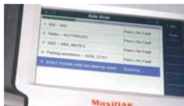
Het uitvoeren van een auto-scan gaat gemakkelijk.

op heden waren de updates voor de Autel Maxidas DS708 kosteloos. Inmiddels is het beleid van Autel echter gewijzigd. Nu dient voor de updates betaald te worden. Ondanks de veelbelovende slogan op de Autel-website heeft de Maxidas mij niet kunnen overtuigen. Hij gaat retour afzender.