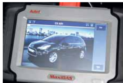
Om de selectie te vereenvoudigen wordt gebruik gemaakt van duidelijke afbeeldingen.