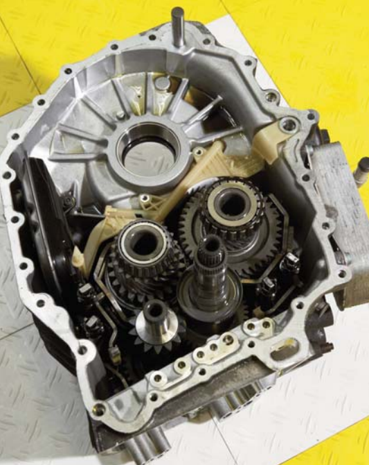
De DSG is gebaseerd op de bekende en betrouwbare 3-assige 02M-bak van Volkswagen.

tabele transmissie is ook de concurrentie niet ontgaan. Inmiddels biedt ook Ford een DSG-bak, en volgend jaar komt PSA ermee.