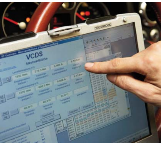
Met de juiste software is te achterhalen wat de parameters zijn waaronder de bak schakelt.

Een hele bekende, waar ook menig Volkswagen-dealer te rade gaat, is TVS Engineering in Aalten. Dit bedrijf heeft grote expertise in de VR6-modellen van Volkswagen en staat bij de kenners te boek als ervaren Chip-tuner, niet alleen voor Volkswagens maar ook voor andere merken race- en straatauto's.