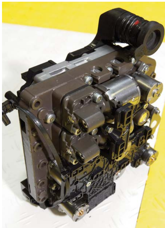
Het onderdeel dat volgens Ronald relatief vaak sneuvelt is de Mechatronic. In dit huis zijn de sensoren, kleppen en regelunit ondergebracht. Repareren blijkt meestal niet mogelijk, vervangen is de enige optie.