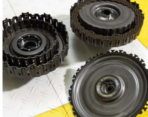
Het huis met de twee koppelingen die met behulp van hydraulische druk worden bediend. Is de buitenste ingeschakeld dan staat de binnenste vrij. Het geheim van het comfort van de DSG-bak zit 'm in het overgangsgebied.